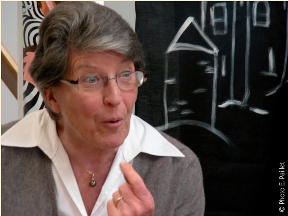
DRANCY 2010 «Le marmiton Gauvain» d'après Max Jacob