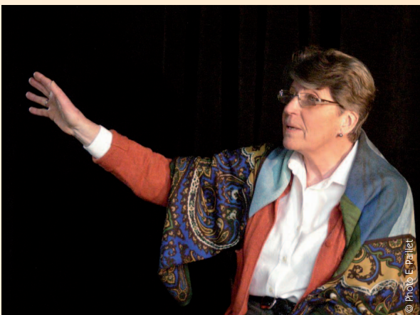
VIENNE-EN-VAL 2012 «Dersou, l'homme de la Taïga»