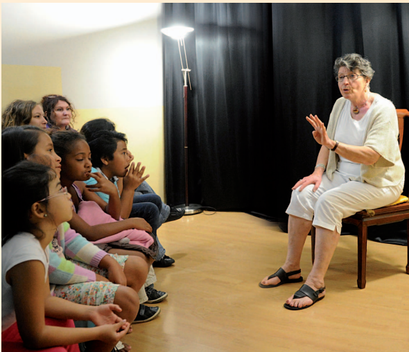
Festival NOUMÉA - 2013