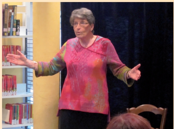
Bibliothèque Madeleine Médiathèque Orléans 2012