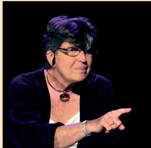
Epos - VENDOME 2012