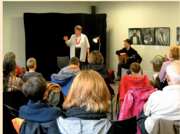
Cercil - ORLÉANS 2011